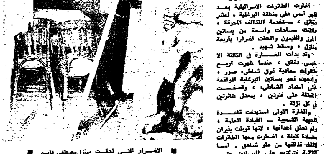
مزل امين نعمة الذي تضرر ، ويبدو ابن صاحب المزل